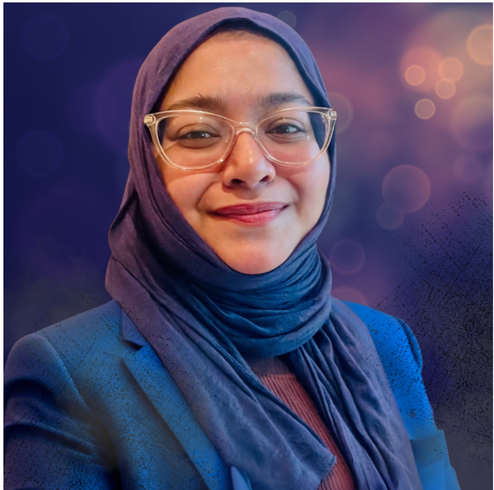
Amra luoop | STREAM Educator & Founder of BootUp - Arcadia British